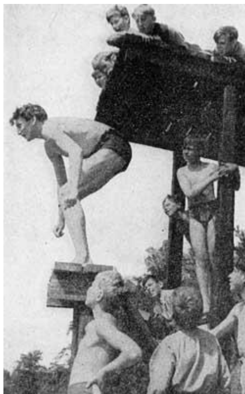
"Hoppa nudå magistern!"