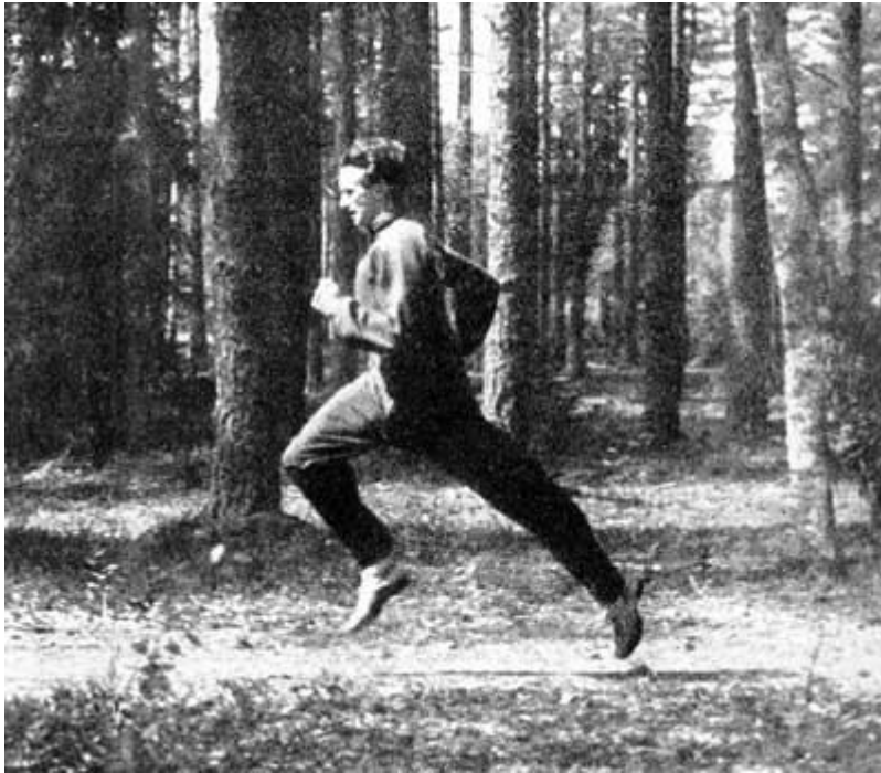
Avspänd fartränning i hänförande miljö - på Skrubbastigarna trivdes han

"För sina världsrekord på 1500 meter och en engelsk mil" löd motiveringen när han i november välförtjänt tilldelades Svenska Dagbladets Bragdmedalj för år 1943.