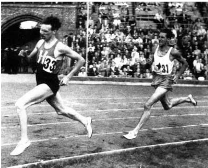
"Jag hade tänkt ta det lugnt, men publiken var så härlig" - världsrekordet på 3/4 mile 1944

En vecka senare, den 5 juli, var det ny Stadiongala, men denna dag springer man skilda distanser, Arne \frac{3}{4} mile och Gunder 2000. Det är en underbar högsommarkväll och känslomänniskan Arne eldas av publiken till stordåd, efter ett sista kanonvarv på 57,5 sänker han amerikanen Moores världsrekord med hela 2,1 sekunder till 2.56,6! Gunder håller igen, nöjer sig med att vinna knappa metern före nye Erik Ahldén. I spalterna läses beska kommentarer: "Gunder Häggs maskning ett svek mot publiken!"