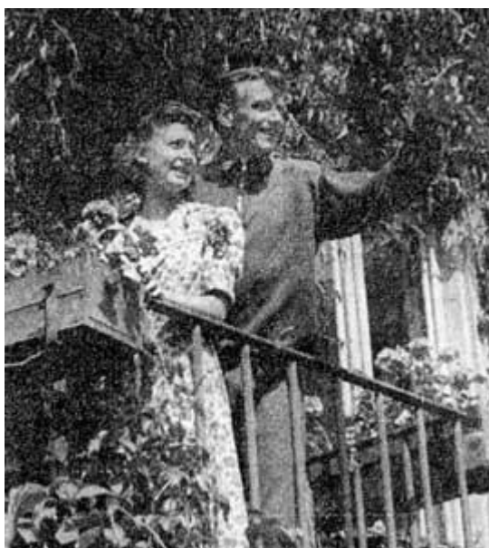
Harmoni och idyll på Skrubba