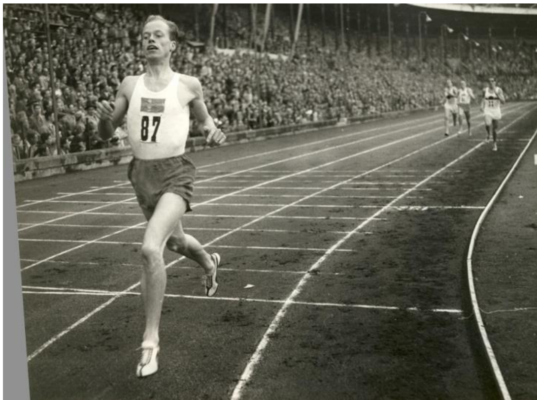
Tyskarna utklassade vid en landskamp på Stockholms Stadion inför fullsatta läktare

Elliot vann loppet på nya världsrekordet 3,36,0 min. Ett fantastiskt rekord. Dan fick för ovanlighetens skull en undanskynd plats, blev bara femma.