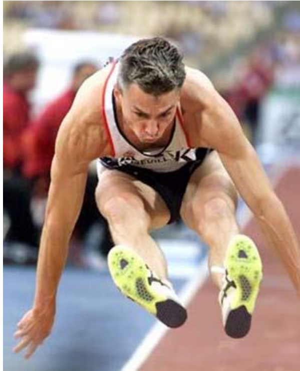
Rekordet från Ullevi fyller snart 10 år!