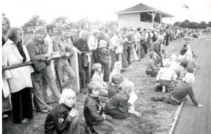
Sommarspelen i Falkenberg 1974 lockade 800 betalande åskådare trots kolstybbsbanor!

Där hade ni tio minnesvärda idrottsstunder från ett liv förslösat på idrott! Men egentligen är det bara bluff och båg.....Mina 10 bästa ögonblick är naturligtvis dels egna tävlingar, dels prestationer som gjorts av aktiva jag tränat. Fast det behåller jag för mig själv.