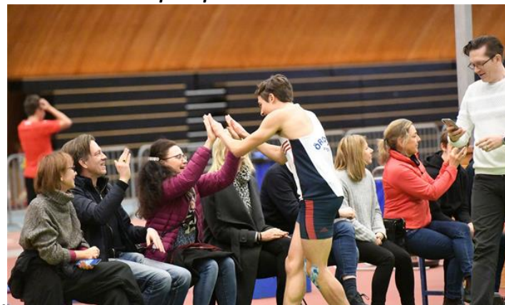
Stor glädje bland Wallmarkarna efter femtonmetershoppet!